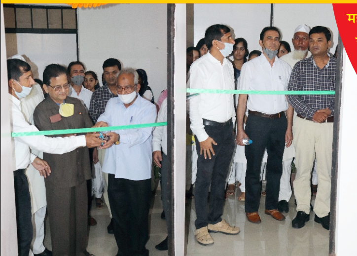
Inaugural Ceremony of Prof. Kamaluddin Conference Hall (17-10-2021)

B.Sc., M.Sc., M. Phil., Ph.D. (AMU) P.D.F. (Japan & USA)