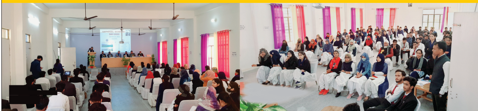
Workshop on Career Opportunities in Government Sector: Challenges & Solution (2021)